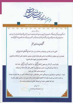
ایده‌ورزان حائز تندیس برترین پشتیبانی در ارزیابی وزارت ICT در سال 1392